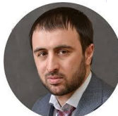
Хуртаев Кантемир Исхакович Председатель "Всероссийского международного союза молодежи"