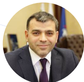
Саидов Зурбек Асланбекович Ректор ЧГУ